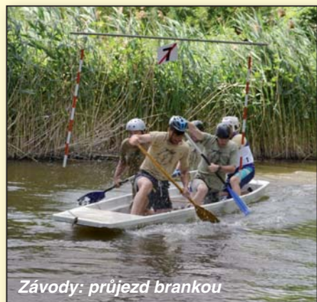
Závody: průjezd brankou

Konec roku je čas, který už ze své podstaty k bilancování přímo vybízí.