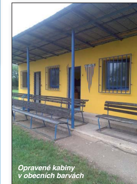
Opravené kabiny v obecních barvách

https://stis.pingpong.cz/html/soutez.php?id=2691&rocnik=2017&oblast=420204 https://stis.ping-pong.cz/html/soutez.php?id=2692&rocnik=2017&oblast=420204