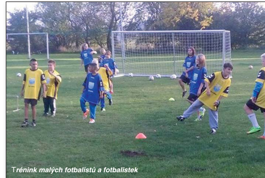
Trénink malých fotbalistů a fotbalistek

Součástí tohoto znovuzrození byla především oprava kabin a úprava okolí hřiště. Za velkého přispění obecního úřadu a jeho mimořádné finanční podpory, za kterou velice děkujeme, a také díky nadšení fandů kopané i samotných dětí při odpracovaných brigádách se podařilo kabiny zrekonstruovat. Provedena byla nová střecha, kompletní omítky, opravy elektroinstalace a vody. Zakoupily se branky pro malou kopanou, čerpadlo na zalévání. Všem chci na tomto místě poděkovat. Zbývá oprava sprch a postupné zlepšování travní plochy hřiště. Snažíme se udržovat i okolí kabin a hřiště. S tím nám pomáhají i místní hasiči, kteří využívají část okolní plochy pro své tréninky.